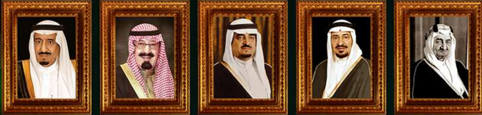
الملك فيصل بن عبد العزيز آل سعود الملك خالد بن عبد العزيز آل سعود الملك فهد بن عبد العزيز آل سعود الملك عبد الله بن عبد العزيز آل سعود الملك سلمان بن عبد العزيز آل سعود